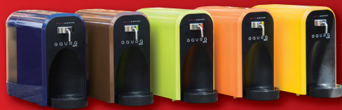
Barve po izbiri